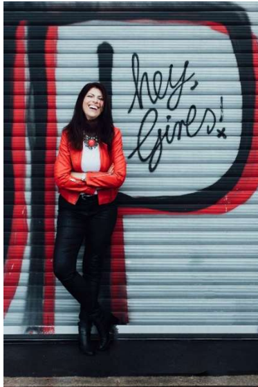
Fotos: Elena Zaucke Photography [NANÉE_ZauckeNJ0012_ret_10x15cm.jpg]