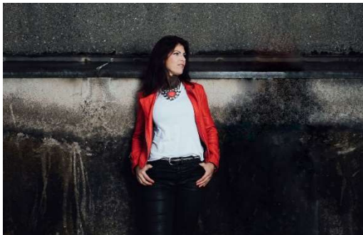
Fotos: Elena Zaucke Photography [NANÉE_ZauckeNJ0008_Solo_ret_quer.jpg]